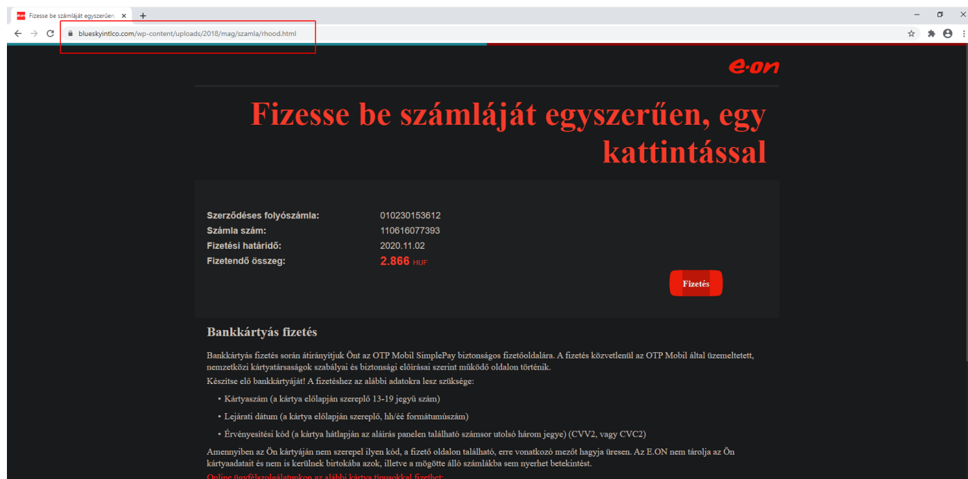
2. ábra E-On-t megszemélyesítő adathalász oldal

A káros weboldalak sok esetben rendkívül jól utánozzák a valódi bejelentkezési felületeket (lásd: 2, 3. ábra) az adott cég arculati elemeinek lemásolásával — például logók, színek, tipográfiai jellemzők —, azonban a weboldal címe ekkor is áruklódó lehet.