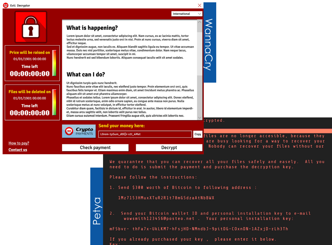
1. ábra: a Wannacry és Notpetya zsarolóvírusok ransom note-jai.

Az alábbi képeken néhány hírhedtebb zsarolóvírus “felületét” szeretnénk bemutatni. Ilyen és hasonló zárolási ablakokkal találkozhat a felhasználó, amennyiben eszköze megfertőződik az említett kártevővel.